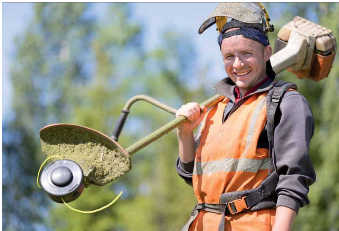
В работе с бензокосой самое главное - безопасность.

Двигатели бывают двухтактные и четырехтактные. Первые попроще, быстро заводятся, но хуже экономят топливо и слабо держат долгие нагрузки. Если вы всерьез озадачились заготовкой кормов, то вам нужен четырехтактный движок.