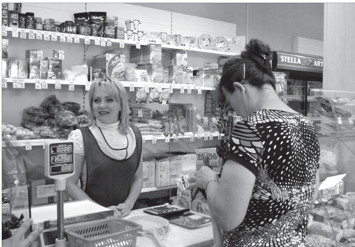
Магазин Череповецкого райпотребсоюза в с. Воскресенском, конечно, не супермаркет, но жители качеством услуг довольны.

В Череповецком районе сегодня 7 потребительских обществ: Большедвор-